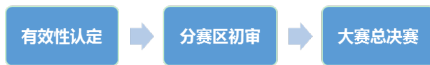
图 1.1 大赛作品评审流程

中国石油工程设计大赛作品评审工作程序主要分为三个阶段：作品的有效性认定、分赛区初审和大赛总决赛。