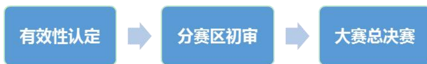
图 1.1 大赛作品评审流程

中国石油工程设计大赛作品评审工作程序主要分为三个阶段：作品的有效性认定、分赛区初审和大赛总决赛。